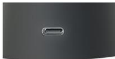
Chargeur usb (type C) inclus