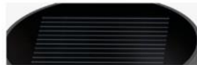
Panneau solaire monocristallin