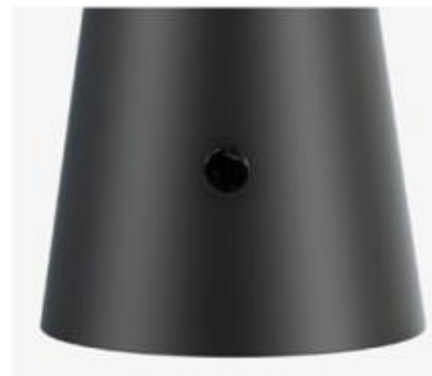
Bouton « Touch »