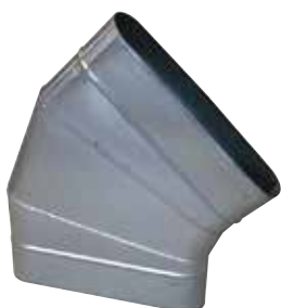
Coude Horizontal Oblong 45°

Le coude horizontal oblong 45° permet de changer la direction d'un réseau oblong de 45° dans le plan du réseau.