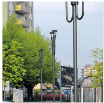
1491 Mât à enterrer