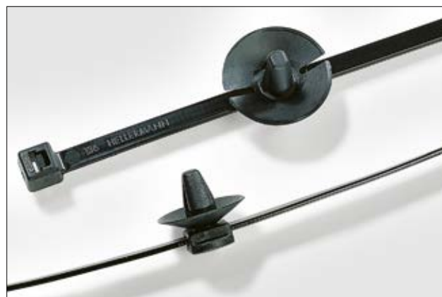
Le pied coulissant facilite le positionnement et le serrage du collier.