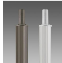
1509 Mât strié Ø120