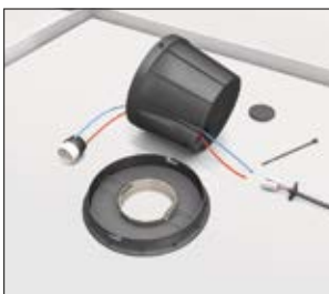
1. Une partie du montage du SpotClip-Box doit se faire au dessus du faux-plafond.