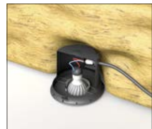
4. Appliquez votre matériau isolant.