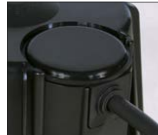
Fermeture de la SpotClip-Box en installant le couvercle et le passe-fil.