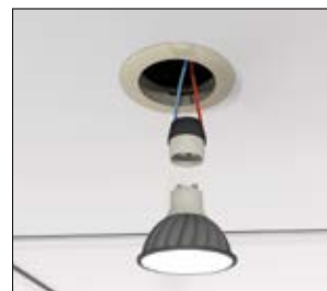
3. Installez la lampe selon la procédure habituelle.