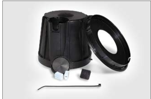
SpotClip-Box est livré en kit complet.