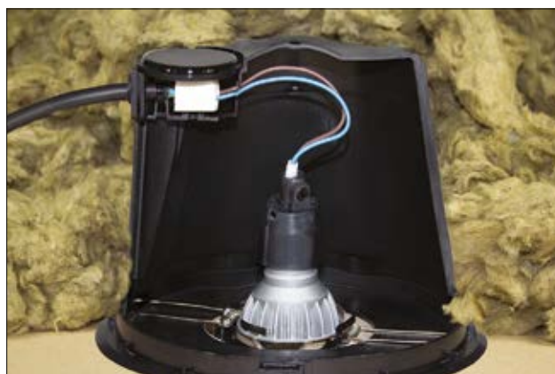
Vue intérieure, en coupe, d'un SpotClip-Box.