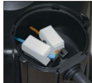
HelaCon Lux connecté au transformateur.