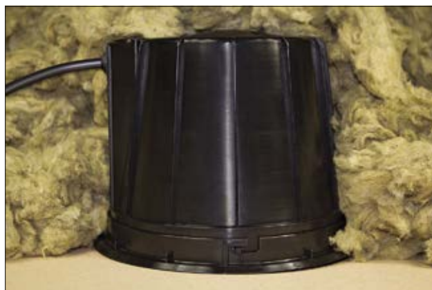
SpotClip-Box - Compatible BBC et répond à la RT2012.

Il est commercialisé sous forme de kit contenant les bornes de raccordement Helacon Lux et tous les éléments de montage nécessaires.