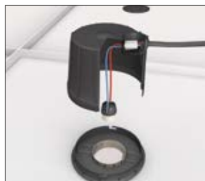
2. Connectez avec le réseau à l'aide des HelaCon Lux inclus dans le kit et verrouillez avec la baïonnette.