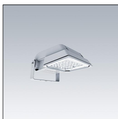
Projecteur LED grands espaces AFP S 36L70-740 A6 BS 3550 CL2 GY 96644825