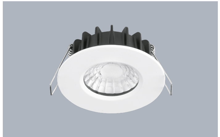
Spot encastré LED SMD fixe gradable triac 7W