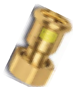
11330 JPG Demi-union à joint plat, pour installations de gaz