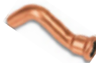
6086 Clarinette à sertir Mâle/Femelle