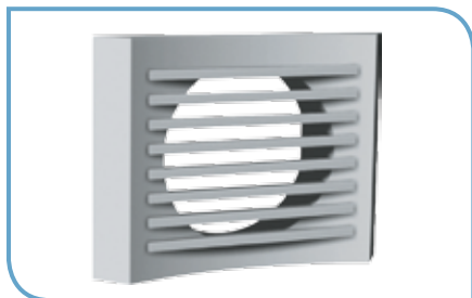
Installation murale - TMM Ailettes horizontales