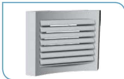
Installation plafond - TMP Ailettes inclinées