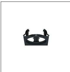
Cadre d'encastrement CAR EVO M Q1 FRAME BK 60800834

La présente déclaration de produit environnemental (EPD) est basée selon les normes EN ISO 14025 et EN 15804 et décrit les impacts spécifiques environnementaux du produit mentionné. Cette déclaration fait suite également aux exigences spécifiques et concrètes du programme Institut Bauen und Umwelt e.V. (IBU) selon les règles de calcul des LCA et le contenu de l'EPD (de base) selon les instructions de PCR sous-jacentes (PCR: Règles de catégorie de produit) pour «Luminaires, lampes et composants pour luminaires» (Ref: IBU PCR Teil A et B). Le produit décrit sert d'unité déclarée. La déclaration inclut une description du produit, des informations sur la composition des matériaux, la production, le transport, la phase d'utilisation, l'élimination et le recyclage, ainsi que les résultats de l'évaluation du cycle de vie. Les EPD des produits de construction sont comparables uniquement si les valeurs sont calculées conformément au même PCR et des scénarios d'utilisation appropriés et obligatoires.