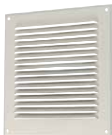
Grille métallique GAT

GAT-GR sont les grilles métalliques d'aération à destination des maisons individuelles et des logements collectifs.