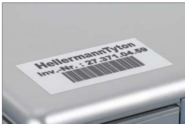
Excellente identification des immobilisations.