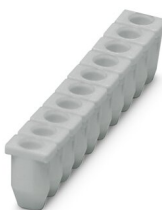
Manchon isolant, coloris: gris

https://www.phoenixcontact.com/fr/produits/3002856