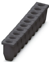
Manchon isolant, coloris: noir

https://www.phoenixcontact.com/fr/produits/3002869