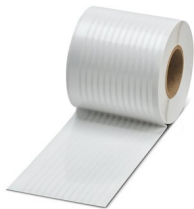
Bandes de repérage, Rouleau, blanc, vierge, repérable avec : THERMOMARK E.300 (D)/600 (D), THERMOMARK ROLL 2.0, THERMOMARK ROLL, THERMOMARK ROLL X1, THERMOMARK ROLLMASTER 300/600, THERMOMARK X1.2, type de montage: collage, surface utile: sans fin x 3,8 mm

https://www.phoenixcontact.com/fr/produits/0801837