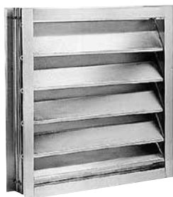
ATO75 1000X500 VOL/GAINE

Le volet en gaine anti-retour ATO 75 permet la mise en dépression ou en surpression d'un local.