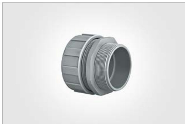
Raccord droit PSR-S.

i Des raccords avec filetage PG à 45° et à 90° sont également disponibles sur demande. Pour découvrir toutes nos solutions, consultez notre catalogue HelaGuard.