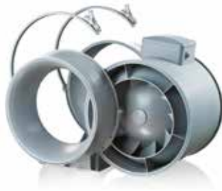
Bloc moteur démontable