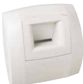
Bahia Curve sanitaire

La bouche BAHIA CURVE S permet de garantir l'extraction suffisante et permanente des pollutions intérieures en fonction du taux d'humidité dans la pièce.