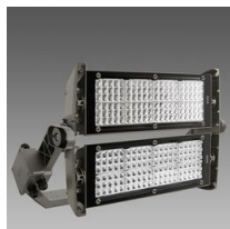
2194 Forum LED - 2 MODULES - asymétrique 60°