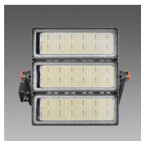
3192 Forum 2.0 - 3 MODULES - symétriques - W