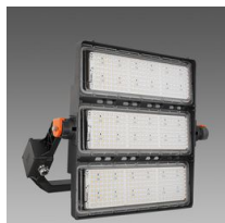
3198 Forum 2.0 - 3 MODULES - faisceau étroit - S