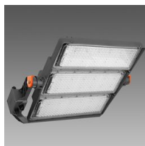
3193 Forum 2.0 - 3 MODULES - asymétrique 30° - AS