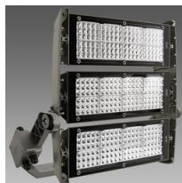
3195 Forum LED - 3 MODULES - asymétrique