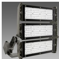
3230 Forum LED - 3 MODULES - symétrique MS