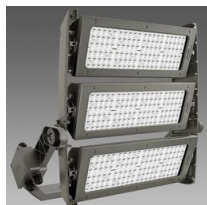
3198 Forum LED - 3 MODULES - faisceau intensif S