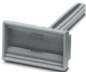
Porte-repère pour barrettes de raccordement, gris, vierge, Type de montage: Enfichage, Surface utile: 20 mm x 8 mm

Remarque : les données indiquées ici sont tirées du catalogue en ligne. Vous trouverez toutes les informations et données dans la documentation utilisateur. Les conditions générales d'utilisation pour les téléchargements sur Internet sont applicables. ( http://phoenixcontact.fr/download )