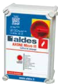
Coffret AXONE 1V/DES-Tri 25.4A TO

AXONE Micro III 1V/DES est un coffret de relayage précâblé et certifié NF permettant de piloter des ventilateurs de désenfumage.