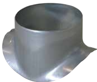
Piquage Equerre Circulaire 90°

Le piquage équerre circulaire permet de réaliser un piquage à 90° sur un conduit circulaire galvanisé.