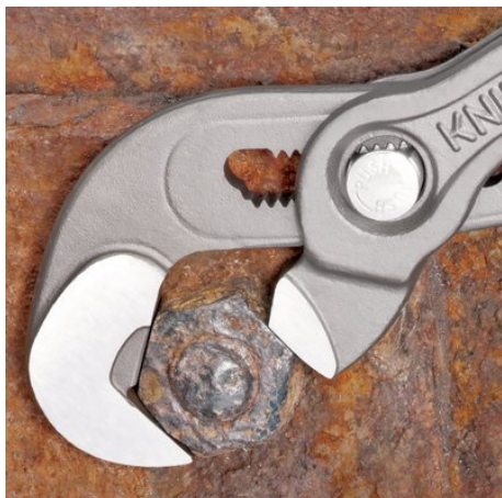
Efficace sur écrous rouillés et arrondis