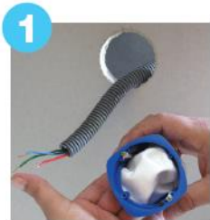
1 Rentrer la poche dans le boîtier