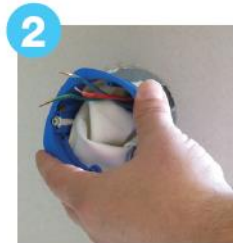
2 Mise en place de la boîte dans le perçage