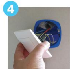
4 Fixation de l'appareillage