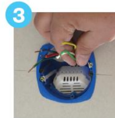
3 Installation du micro module dans la poche