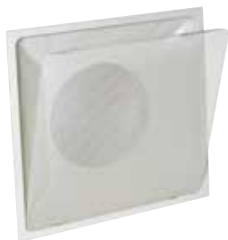
SC370W3 FO 598x598

La grille pour dalle de plafond SC 370 assure la reprise d'air dans les installations de ventilation et de climatisation avec une esthétique discrète.