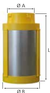
PAS 125 DF

PAS 125 DF : piège à sons spécial pour limiter le bruit rayonné (lot de 2), raccordement mâle/femelle.