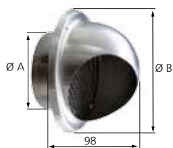
ME INOX 125 / 160

Entrée ou sortie d'air murale avec faible perte de charge jusqu'à 200 m 3 /h. Emboîtement direct dans le conduit.