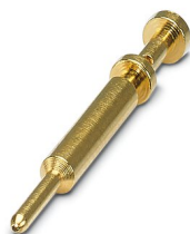
Contact à sertir, Mâle, tournés, diamètre de contact: 1 mm, zone de sertissage: 0,06 mm 2 ... 0,25 mm 2

https://www.phoenixcontact.com/fr/produits/1623607