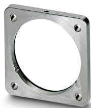
Bride de montage à quatre pans, 4x Ø4,2, série: SM

https://www.phoenixcontact.com/fr/produits/1607937