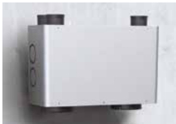
Caisson de répartition InspirAIR®

Caisson de répartition InspirAIR® Side 240