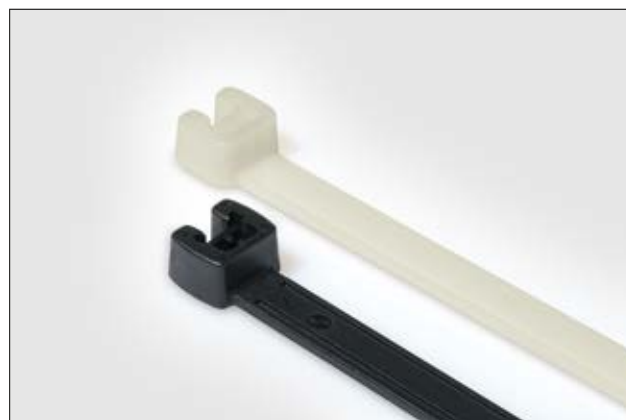
Colliers de la série Q.