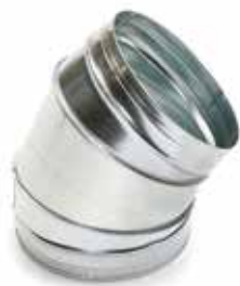
Coude 45° secteur

Le coude 45° permet de changer la direction d'un réseau galvanisé de 45°.