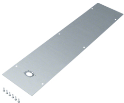
Couvercle BKW200 avec perfo. 50mm