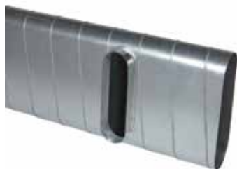
Piquage Droit Oblong sur Plat

Le piquage droit oblong sur plat 90° permet de réaliser un piquage à 90° sur un conduit de type oblong ou rectangulaire galvanisé.