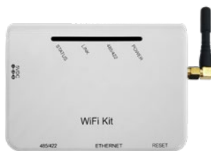
Datalogger série Easy