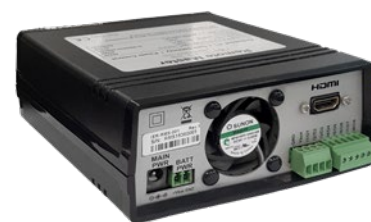
Datalogger série Professional