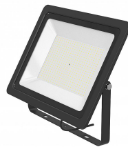
141545 LED Projecteur Slim 150W 12600lm 6500K