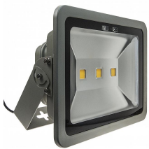
90500032464 LED Projecteur Gris 150W 15960lm 6500K 100V-240V