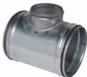
Té Equerre à joints

Le TE 90° à joints permet de raccorder deux conduits galvanisés avec un angle de 90° tout en assurant une étanchéité classe C.