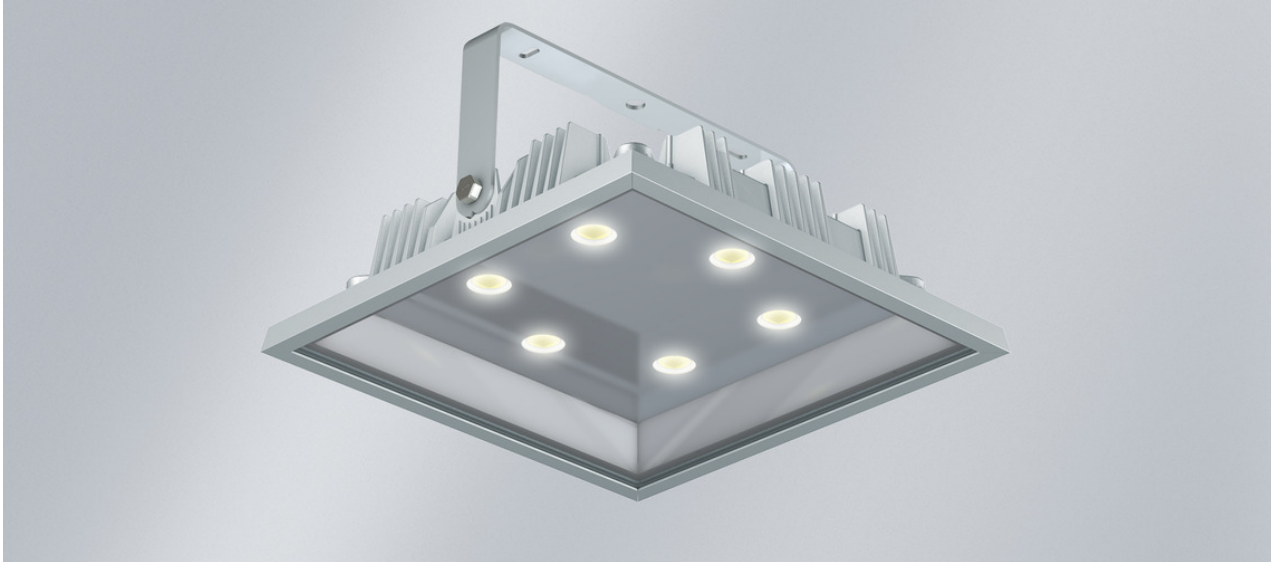
L'illustration peut différer