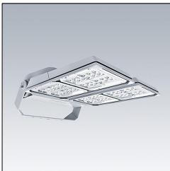
Projecteur LED grands espaces AFP L 144L50-740 A6 BS 3550 CL2 GY 96644627