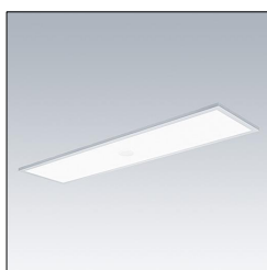
Luminaire LED encastré OP2 4400-840 CKIT+ MPT 3X12 96633165

La présente déclaration de produit environnemental (EPD) est basée selon les normes EN ISO 14025 et EN 15804 et décrit les impacts spécifiques environnementaux du produit mentionné. Cette déclaration fait suite également aux exigences spécifiques et concrètes du programme Institut Bauen und Umwelt e.V. (IBU) selon les règles de calcul des LCA et le contenu de l'EPD (de base) selon les instructions de PCR sous-jacentes (PCR: Règles de catégorie de produit) pour «Luminaires, lampes et composants pour luminaires» (Ref: IBU PCR Teil A et B). Le produit décrit sert d'unité déclarée. La déclaration inclut une description du produit, des informations sur la composition des matériaux, la production, le transport, la phase d'utilisation, l'élimination et le recyclage, ainsi que les résultats de l'évaluation du cycle de vie. Les EPD des produits de construction sont comparables uniquement si les valeurs sont calculées conformément au même PCR et des scénarios d'utilisation appropriés et obligatoires.