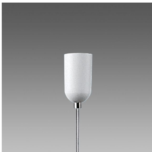
2510 Sospensione mono