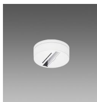
Acc. base pour adaptateur universel et GRAD. 1/10V-DALI