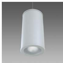
1395 Cilindro en suspension - COB