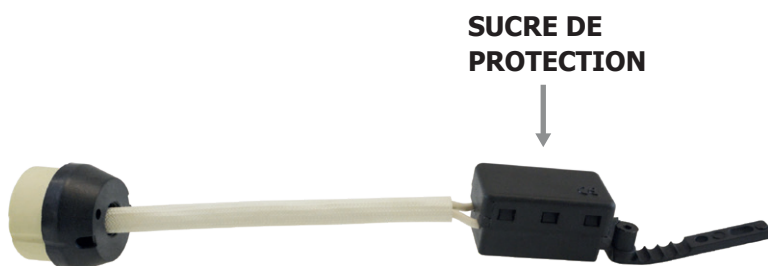
DOUBLE CÂBLE GAINÉ