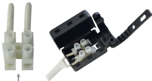
CONNECTION PAR DOMINO