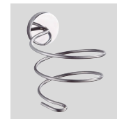
Support COMET-S Support mural métallique (accessoire non inclus)

Sèche-cheveux ultra-rapide et léger de type professionnel. Permet de combiner deux puissances de séchage avec trois vitesses de fonctionnement. Il est pourvu d'une buse fine amovible et d'une position air froid, pour s'adapter à tous les styles.