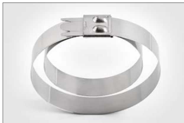
Collier métallique, double toron, MBT_UHD.