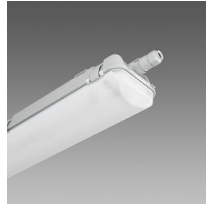
957 Echo FS - bi-émission LED - High Performance