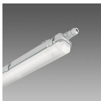
927 Echo - mono-émission LED - Energy saving