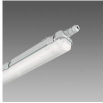
957 Echo - mono-émission LED - High Performance