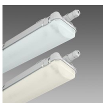
927 Echo 3 000K 6 500K - module double LED - ES