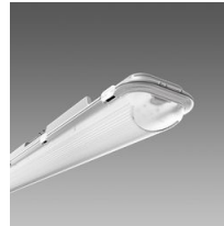
971 Ottima - High Performance