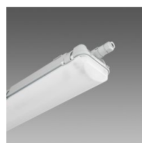
957 Echo - bi-émission LED - High Performance