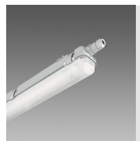
927 Echo - mono-émission LED - DÉTECTEUR DE PRÉSENCE