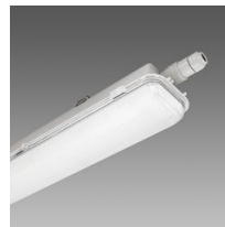
963 Hydro LED - High Performance