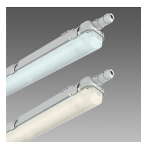
927 Echo 3 000K 6 500K - module simple LED - ES