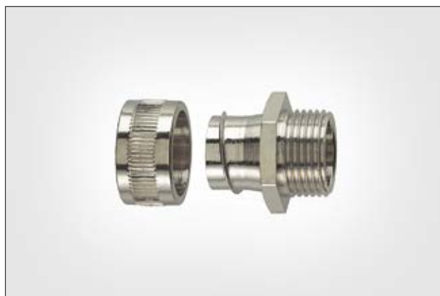
Raccord HelaGuard SC-FM avec filetage externe fixe.