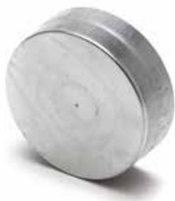
Bouchon Mâle Femelle

Le Bouchon Mâle Femelle permet de boucher un conduit ou un accessoire en acier galvanisé dans les locaux tertiaires et les logements collectifs.