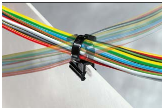
Lanière pour bord de tôle en application et orientable à 90°.