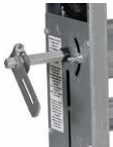
Poignée de commande CRGE / CRGN