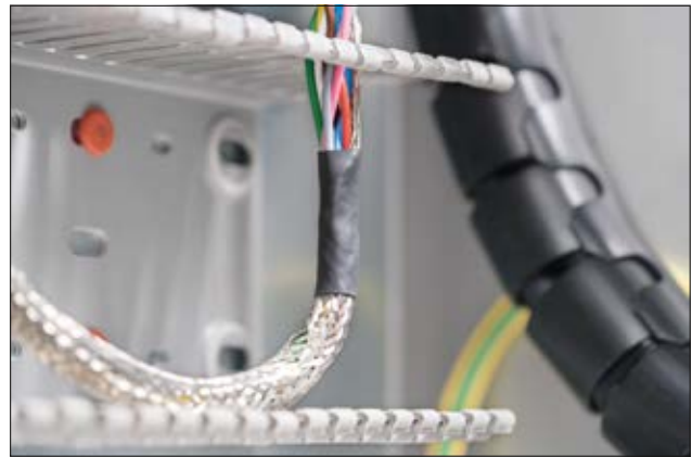
TF21 - Disponible dans une grande gamme de couleurs et de tailles.